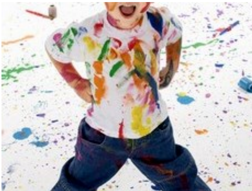
Kunst op school